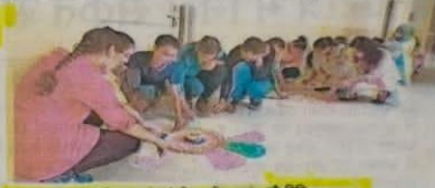
आइएफटीएम विद्यापीठालय में रंगोली बनाती छात्राएं